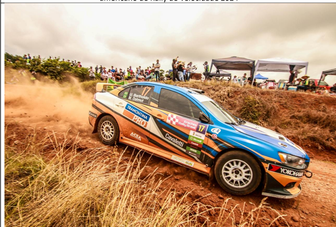
Competição da etapa do Brasil do Campeonato Sul-americano de Rally de Velocidade