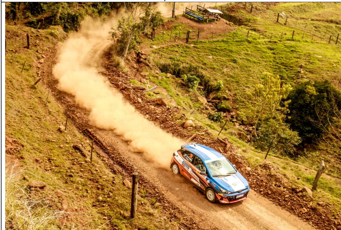
Competição do Rally Nova Itália 2024