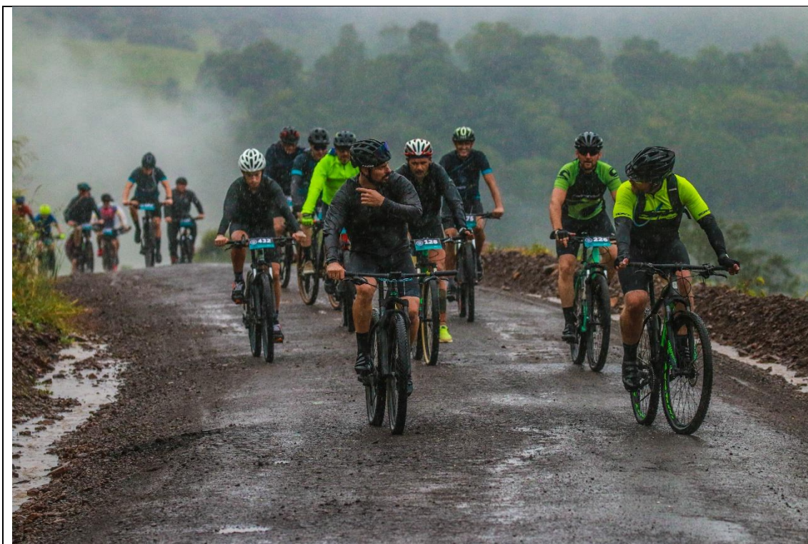
Pedal Nova Itália 2024