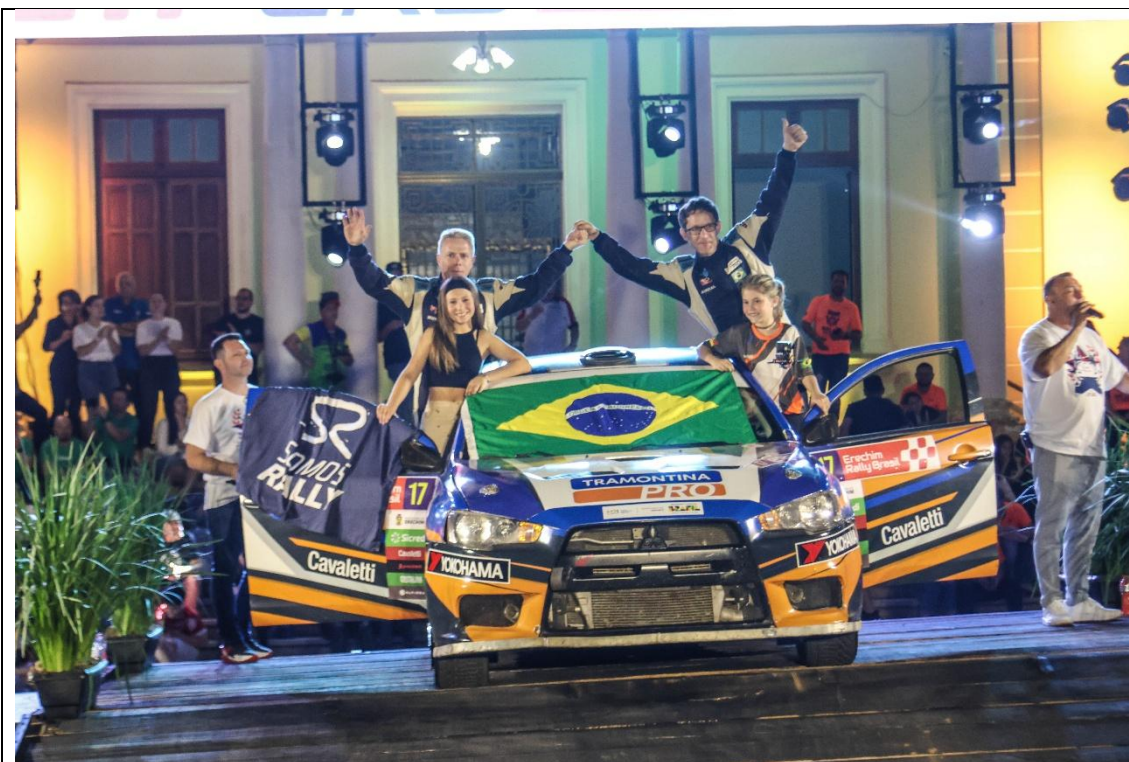
Dupla de atletas que representou o Brasil na disputa do evento de Erechim/RS, etapa do Sul-americano de Rally de Velocidade 2024