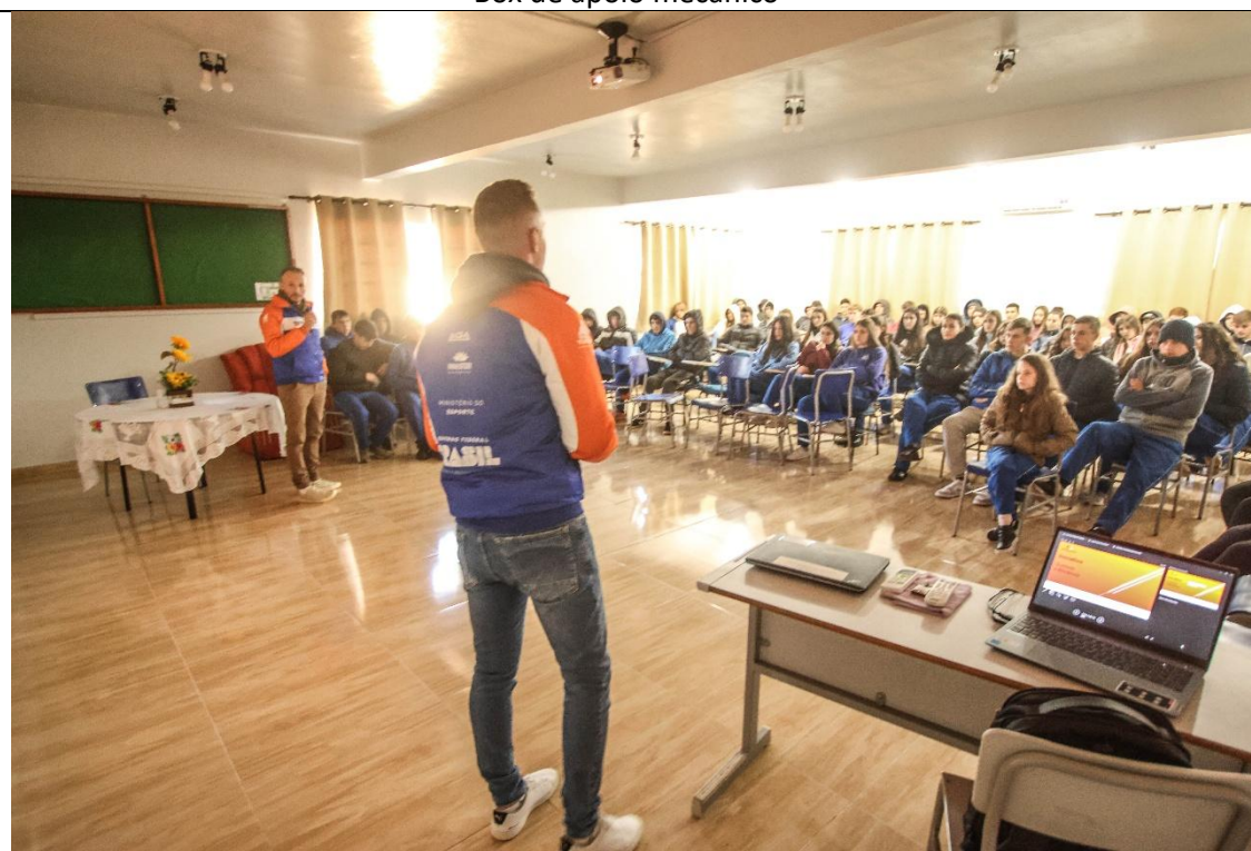
Ação social Sonhar o Primeiro Passo, para alunos de escolas públicas