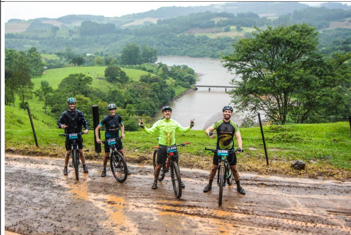
Evento percorreu trilhas por diversos pontos turísticos de Severiano de Almeida