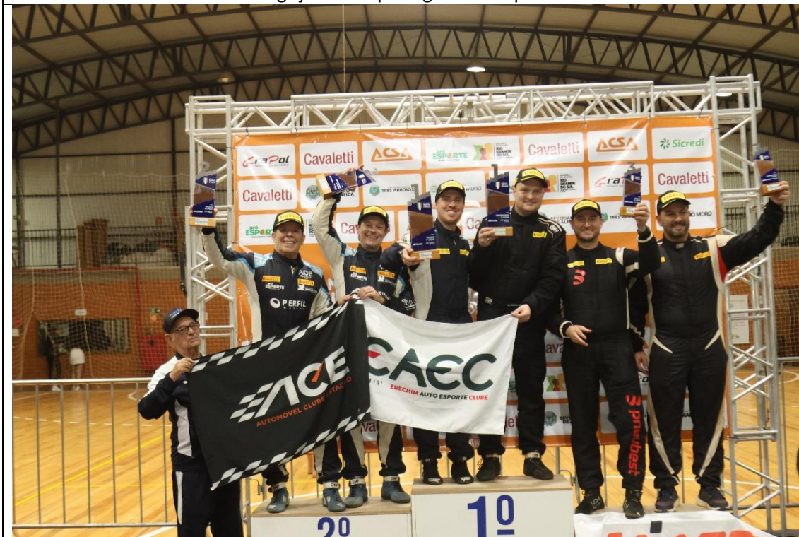
Pódio do Rally Nova Itália 2024