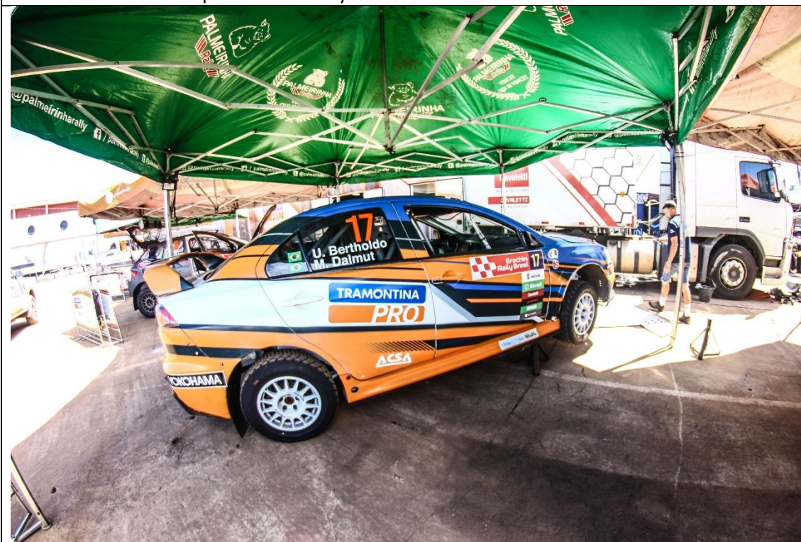
Box de assistência mecânica