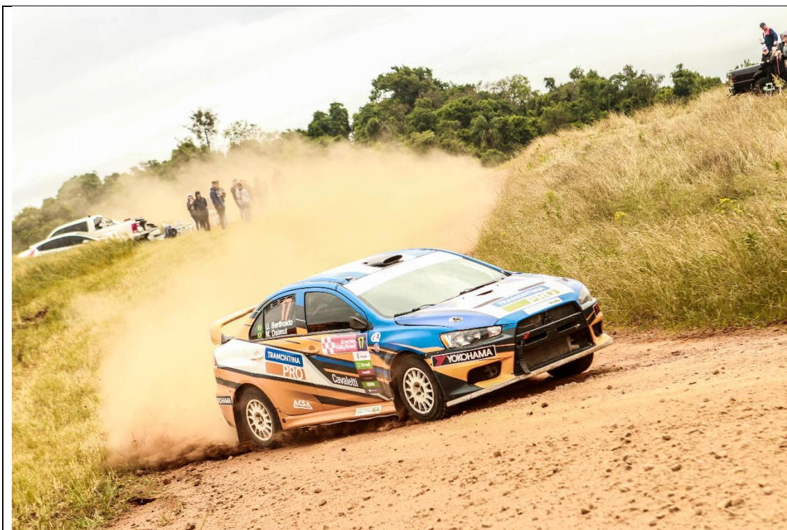
Competição da etapa do Brasil do Campeonato Sul-americano de Rally de Velocidade