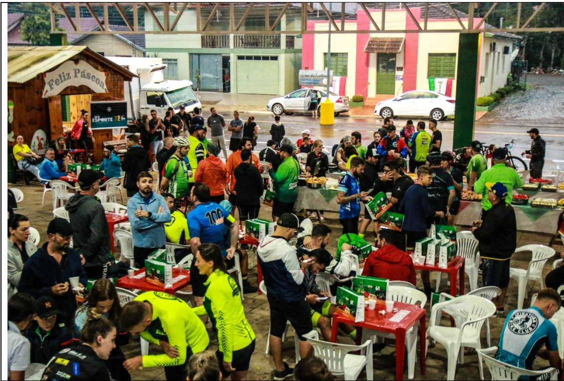
Evento reuniu centenas de ciclistas de diversas cidades de RS e SC