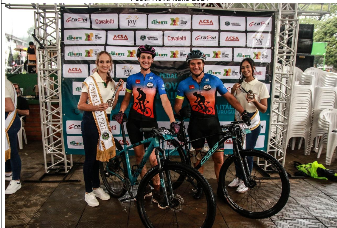
Entrega de premiação aos ciclistas