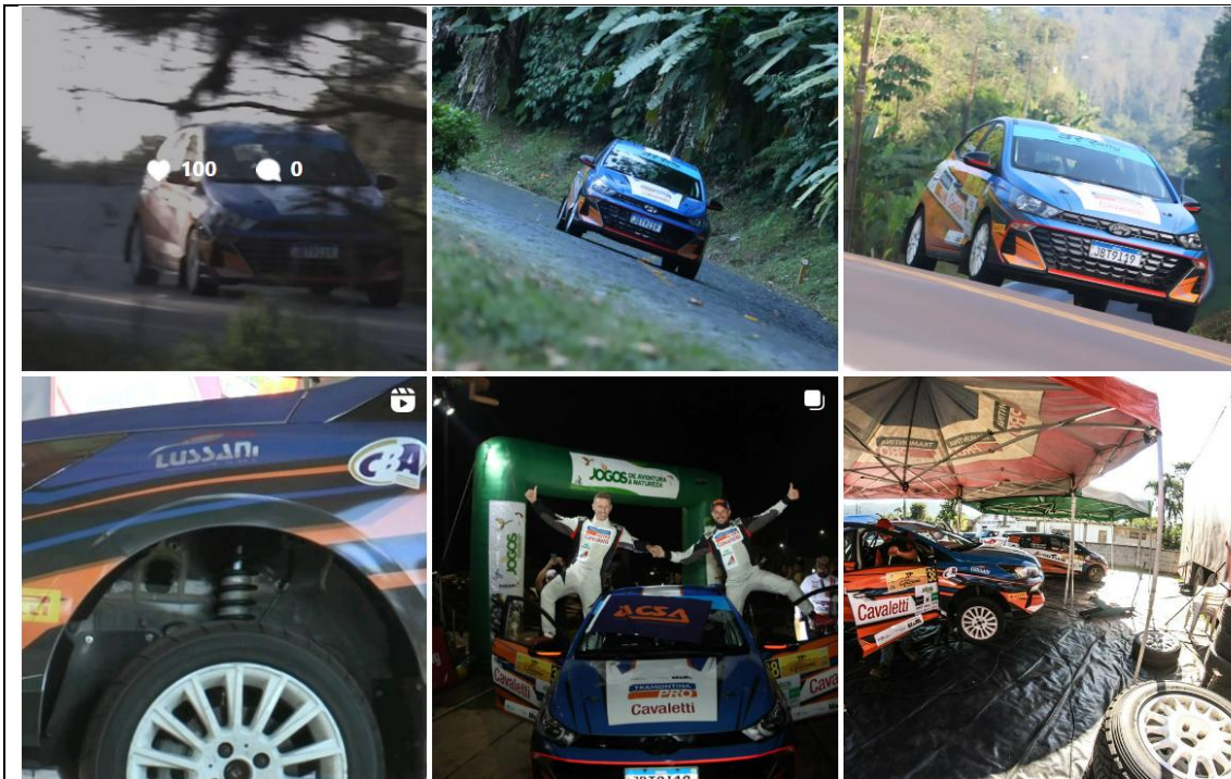
Divulgação do projeto nas redes sociais oficiais do ACSA