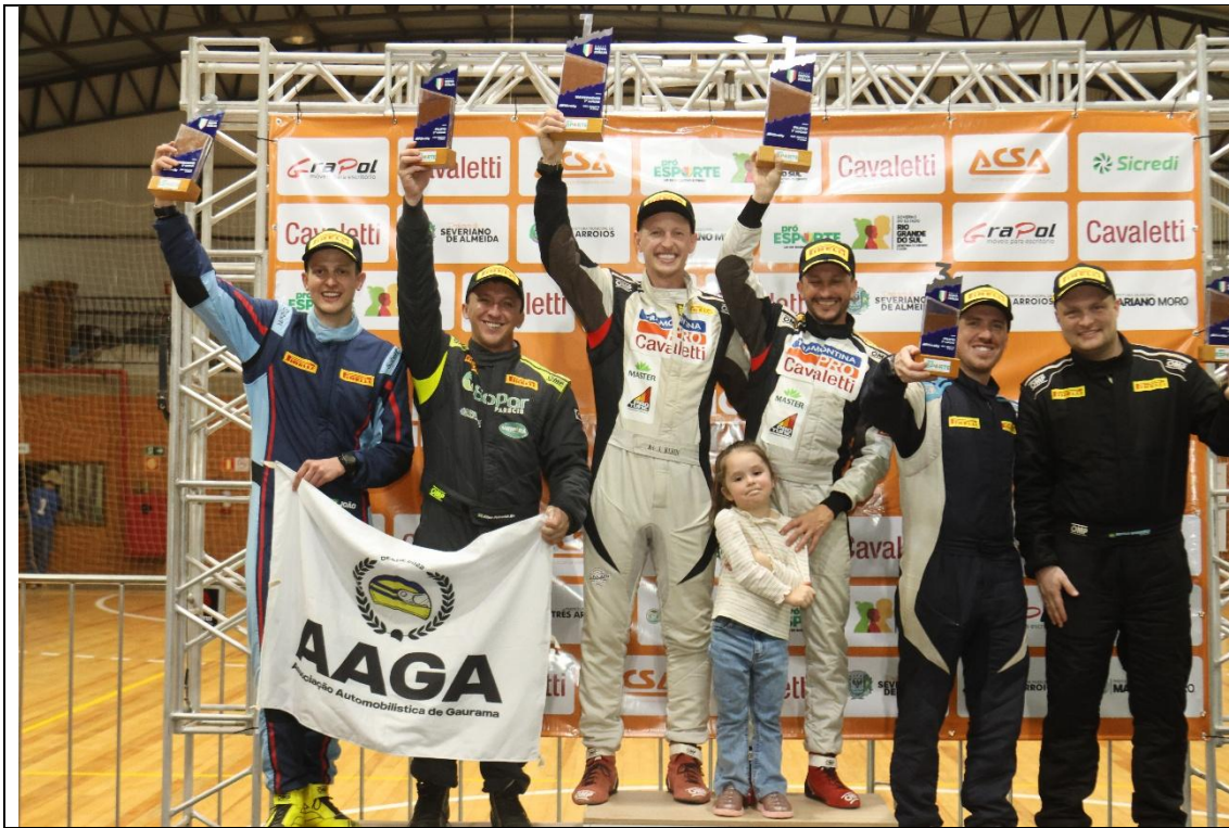
Pódio do Rally Nova Itália 2024