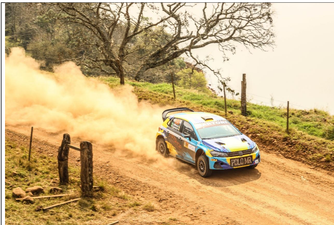
Competição do Rally Nova Itália 2024