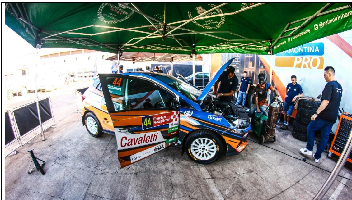
Box de apoio mecânico